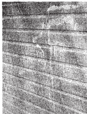
Schmierereien „zieren“ die Wände der Hütte.