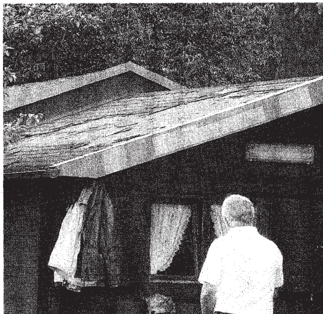
Die Schindeln aus Dachpappe wurden abgerissen und als Frisbees durch die Gegend geschleudert.

Die Schäden am Dach müssen zwischen Sonntag, 20. Juli, und Dienstag, 22. Juli, entstanden sein. Franz